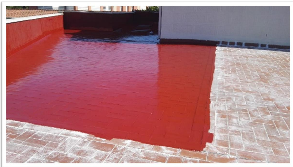
Aplicación de una mano de imprimación epoxi Preimper